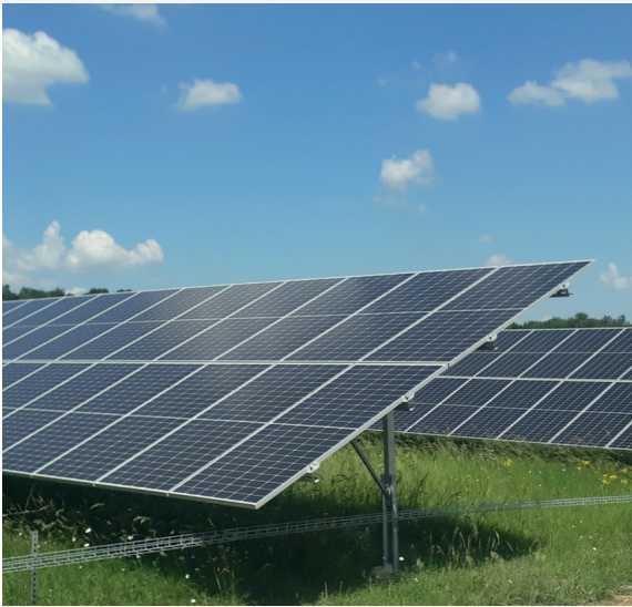
Une autre belle réalisation agrivoltaïque du Groupe VALOREM en Dordogne, le parc de La Tour Blanche.

L'installation d'un parc solaire a pour objectif de produire de l'électricité . En fonction des équipements mis en place, la production sera plus ou moins importante .